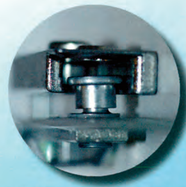
Einbruchhemmende Schließteile für Ihre Sicherheit

Die Ecklager sind höhen-, seiten- und anpressdruckverstellbar.